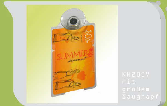
KH200V mit großem Saugnapf