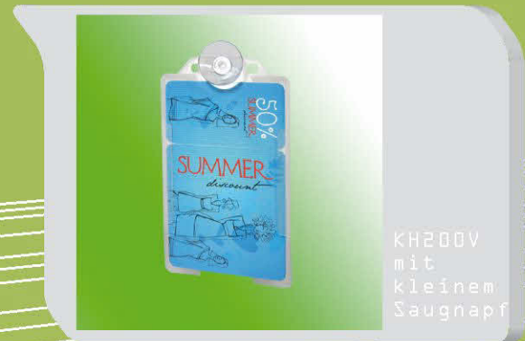
KH200V mit kleinem Saugnapf