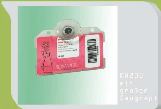
KH200 mit großem Saugnapf