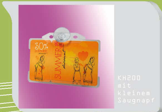
KH200 mit kleinem Saugnapf